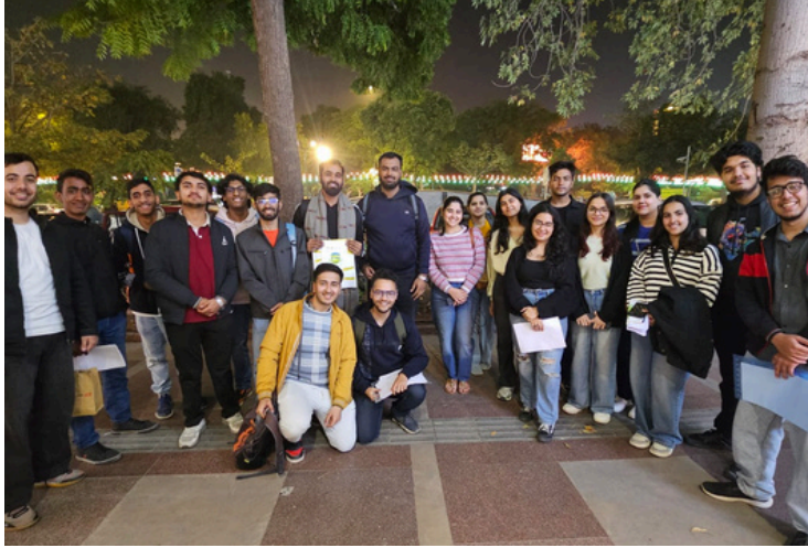
Le Rotaract Club Vacoas scelle une amitié avec le Rotaract Club of MERAKI, à Delhi (Inde), à travers un échange de fanions. Un symbole fort de partenariat et d'ouverture internationale au service des communautés